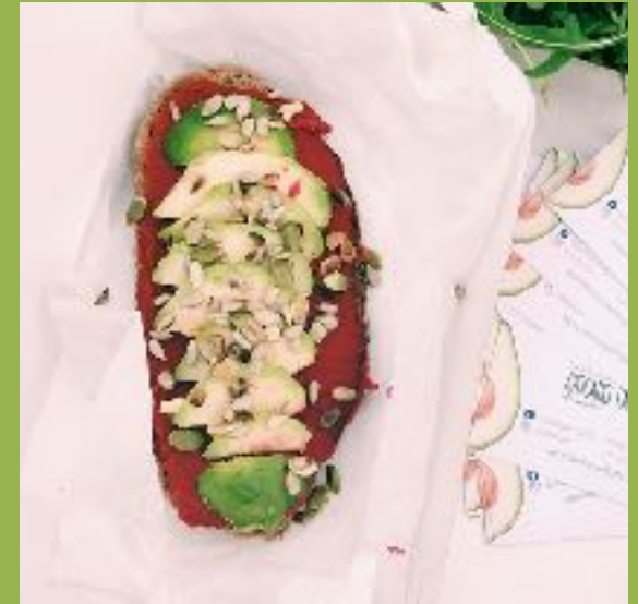
Тост со свекольным хумусом и авокадо

Идеальный тост для вегетарианцев - хумус домашнего приготовления в сочетании с яркой свеклой, свежие ломтики авокадо и микс из семечек