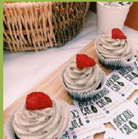
Капкейки с соусом из авокадо

Наш шеф-кондитер придумал нежнейший крем с ноткой свежего авокадо. База капкейков самая разнообразная - шоколадные, ванильные, черничные и морковные