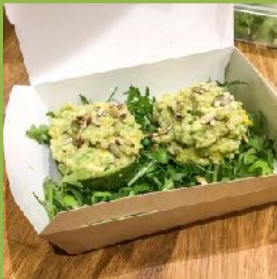
Салат в лодочке из авокадо

Салат из рая - киноа, кусочки авокадо и тающего во рту тайского манго, приправленный нашим фирменный зеленым соусом из авокадо. Подается в лодочке из авокадо на подушке из рукколы