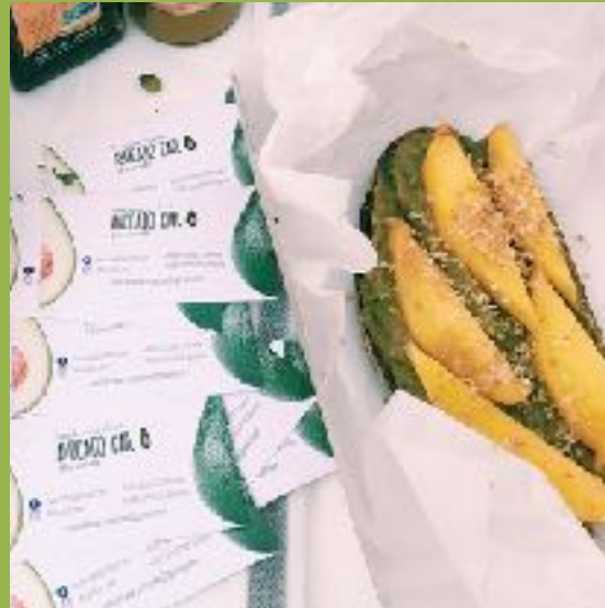
Тост с гуакомоле и тайским манго

Уникальное сочетание острого мексиканского соуса гуакомоле и нежного тайского манго с цедрой лайма