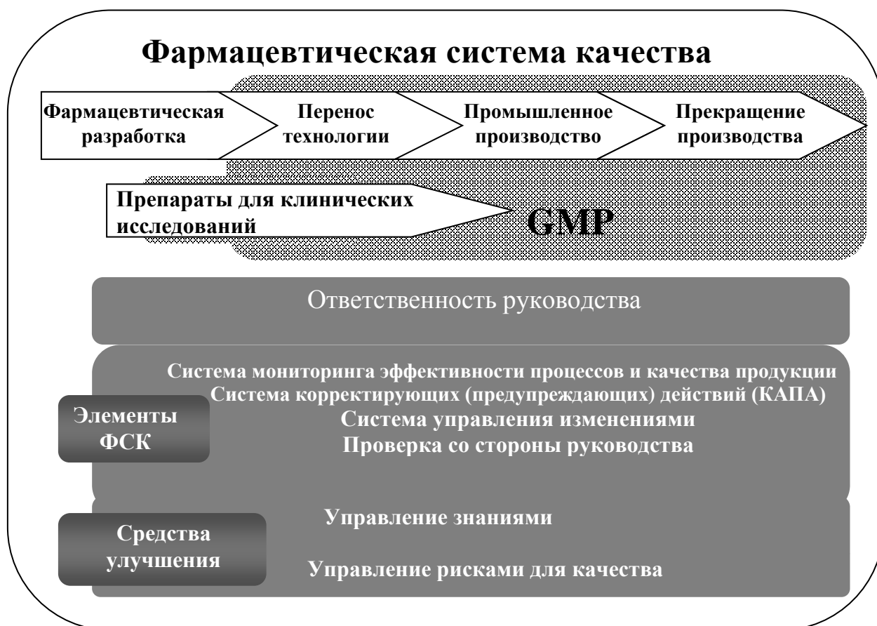
СХЕМА модели фармацевтической системы качества

На схеме показаны основные особенности модели фармацевтической системы качества (далее – ФСК). ФСК охватывает весь жизненный цикл продукции, включая фармацевтическую разработку, перенос технологии, промышленное производство и прекращение производства.