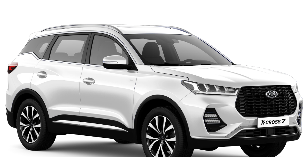
ИНЕЙ (БЕЛЫЙ ПЕРЛАМУТРОВЫЙ МЕТАЛЛИК) / 292