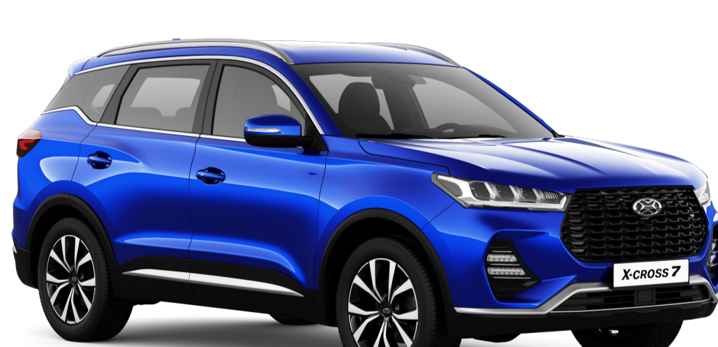
ПАРАДИЗ (ЯРКО-СИНИЙ МЕТАЛЛИК) / 454