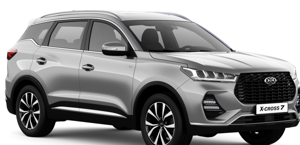
РОСА (СЕРЕБРИСТЫЙ МЕТАЛЛИК) / 642