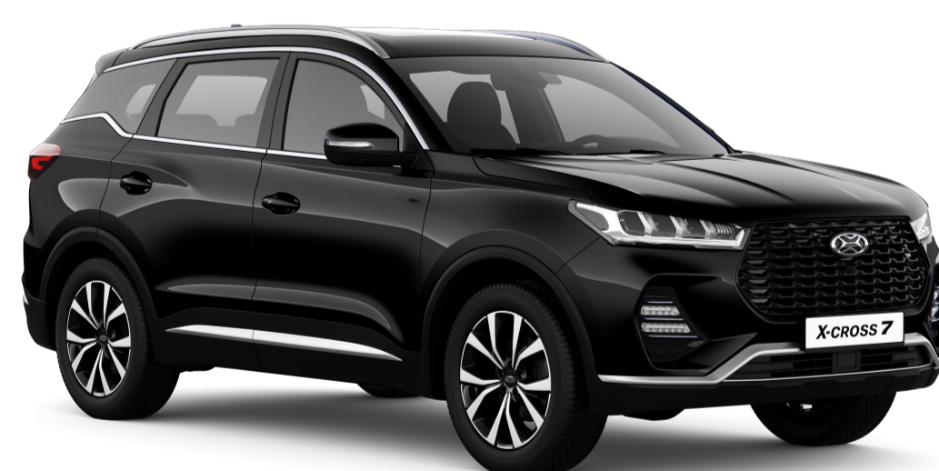
ЛУННОЕ ЗАТМЕНИЕ (ЧЕРНЫЙ МЕТАЛЛИК) / 621