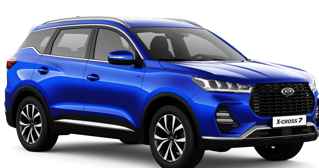
ПАРАДИЗ (ЯРКО-СИНИЙ МЕТАЛЛИК) / 454