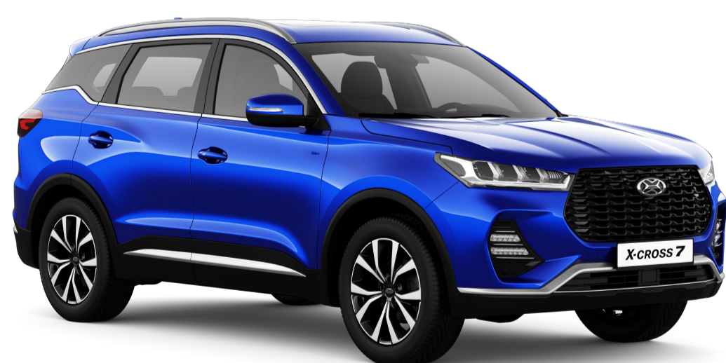
ПАРАДИЗ (ЯРКО-СИНИЙ МЕТАЛЛИК) / 454