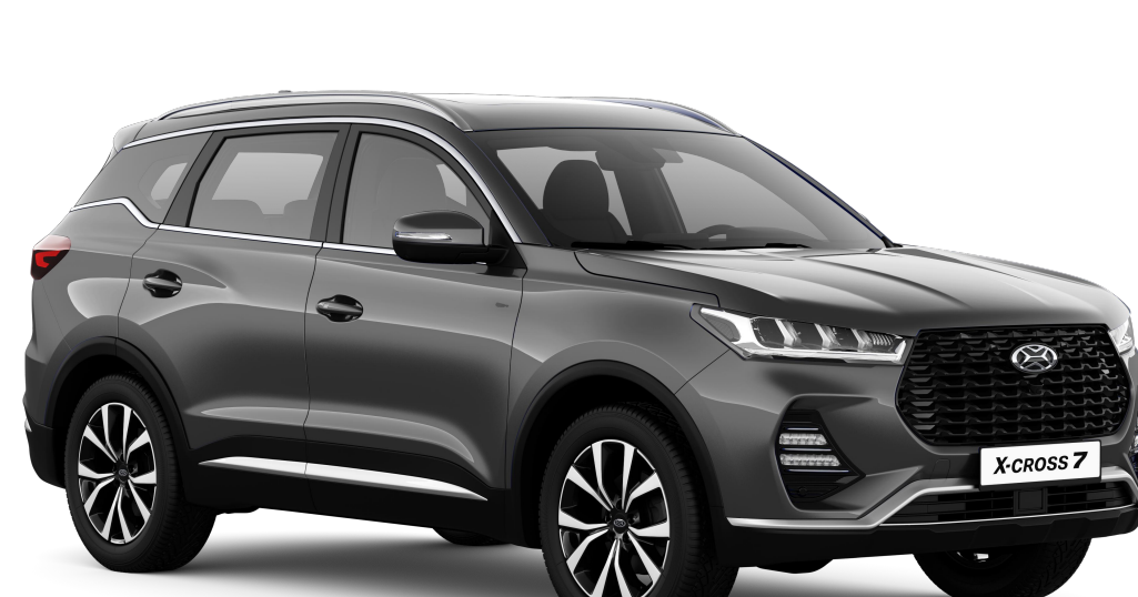
МАГНАТ (СЕРЫЙ МЕТАЛЛИК) / 609