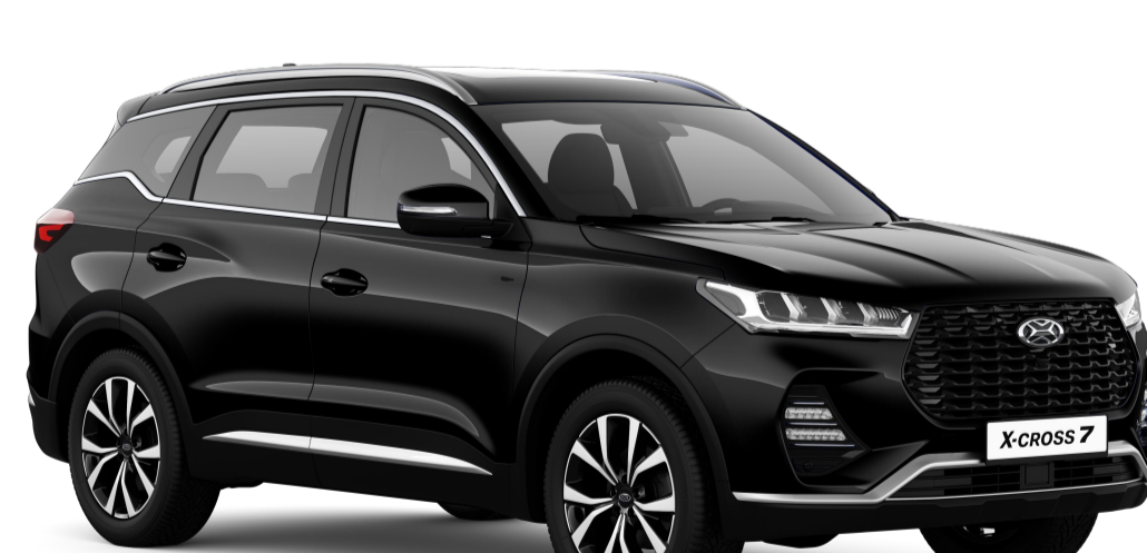
ЛУННОЕ ЗАТМЕНИЕ (ЧЕРНЫЙ МЕТАЛЛИК) / 621