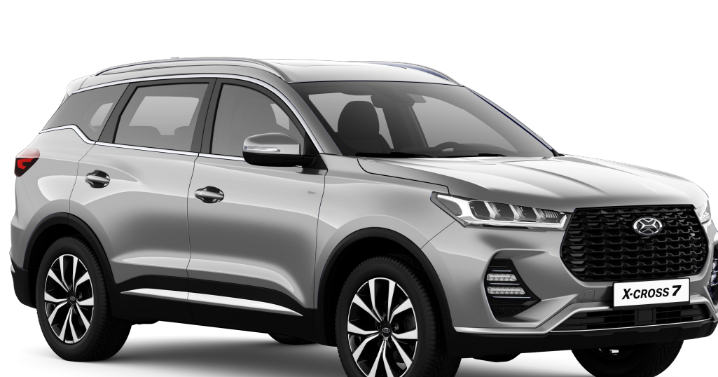
РОСА (СЕРЕБРИСТЫЙ МЕТАЛЛИК) / 642