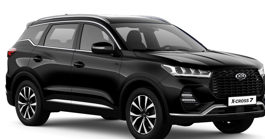
ЛУННОЕ ЗАТМЕНИЕ (ЧЕРНЫЙ МЕТАЛЛИК) / 621