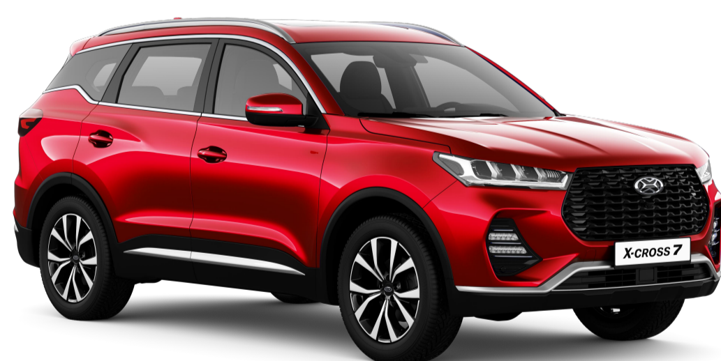
ОВАЦИЯ (КРАСНЫЙ МЕТАЛЛИК) / 174