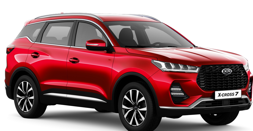
ОВАЦИЯ (КРАСНЫЙ МЕТАЛЛИК) / 174