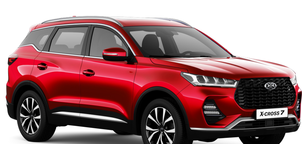
ОВАЦИЯ (КРАСНЫЙ МЕТАЛЛИК) / 174