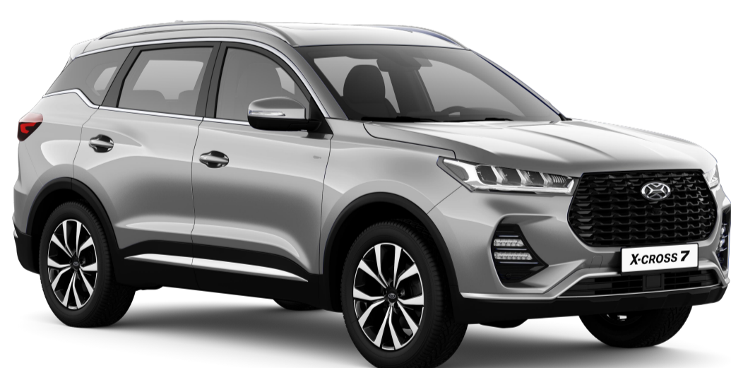
РОСА (СЕРЕБРИСТЫЙ МЕТАЛЛИК) / 642