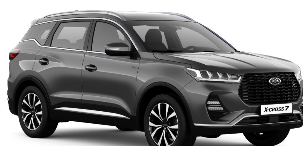
МАГНАТ (СЕРЫЙ МЕТАЛЛИК) / 609